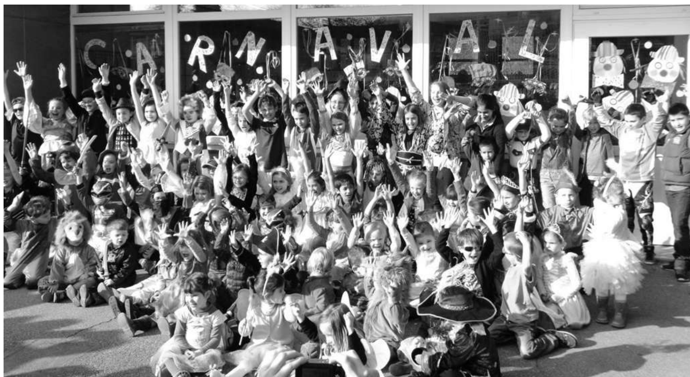
La classe de MS-GS

Princesses, Tortues Ninja et autres chevaliers ont défilé sous un soleil printanier.