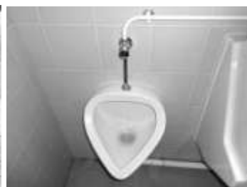
Nous avons mené l'enquête dans l'école pour y trouver tous les points d'eau