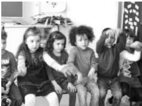
Nous faisons le mouvement des vagues sur la mer