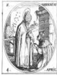
Saint-Ambroise - Patron des apiculteurs

Jean-Michel réalise 3 collectes de miel par an. Le cycle des floraisons lui dicte le bon moment de la récolte.