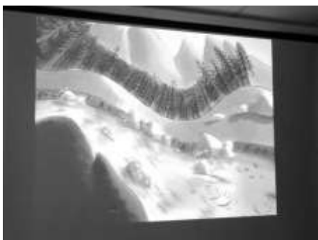
Un petit film nous a raconté la vie d'une goutte d'eau.