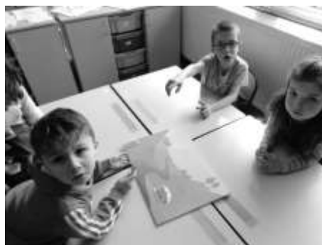
A nous d'essayer tous seuls de compléter le schéma !