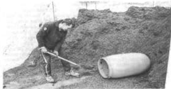
Le tonnage des déchets fermentescibles a augmenté de 18 %. Ces déchets sont transformés à la composterie de Marbach et le compost est récupéré par les habitants du Bassin.

Les bacs destinés aux déchets résiduels ont été pucés, afin de relever la fréquence de présentation à la collecte. En effet, les nouvelles consignes données étaient d'attendre que le bac soit